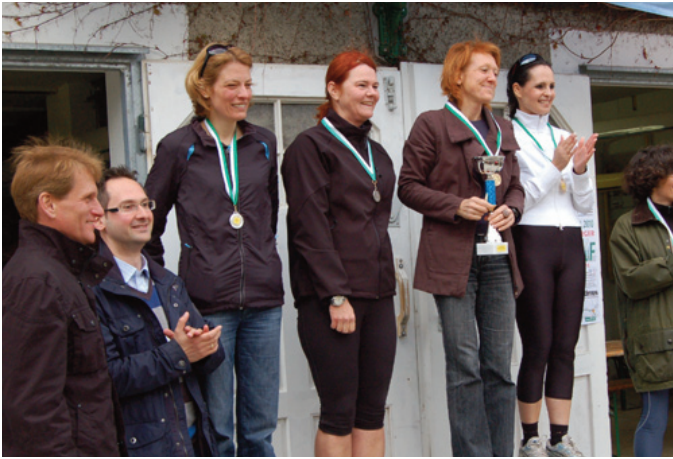
Weitere alemannische Erfolge und gute Platzierungen im Hauptlauf waren